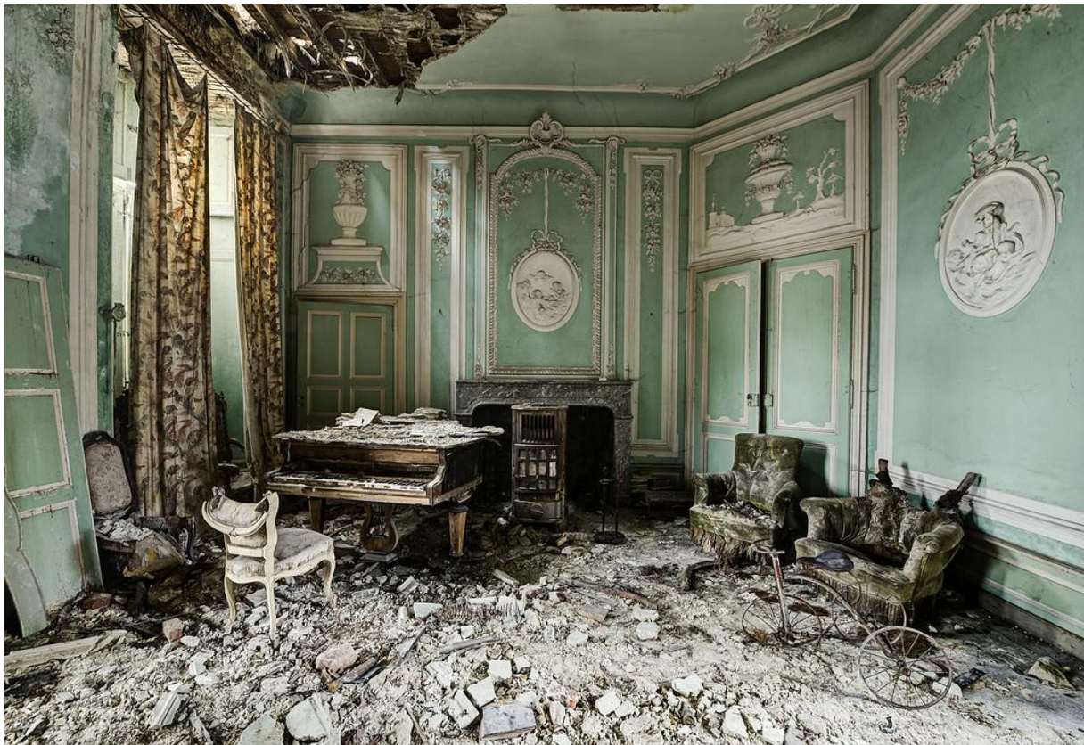
2. ábra: Dekadencia és bomlás

Ez maga a túlélés. Olyan, mint gyerekkoromban a tónál: önfeledtség az egyik pillanatban, aztán veszély a másikban, és azon múlik az egész, hogy idejében észreveszem-e a bajt, hogy meg tudok-e kapaszkodni”. (11. stádium)