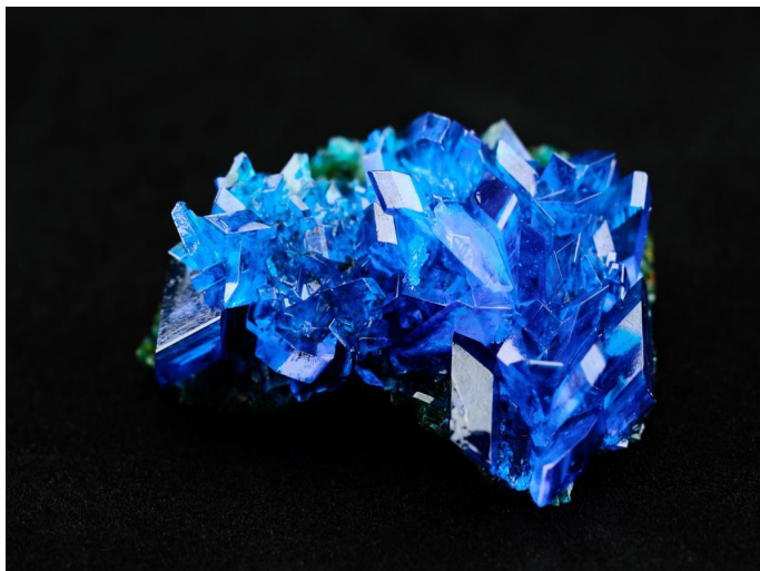
1. ábra: Cuprum sulphuricum kristály

Kulcsszavak: kényszerbetegség, Vas sor, stádiumok, Cuprum, Sulphur